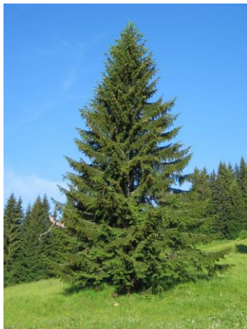
Obrázok č. 1